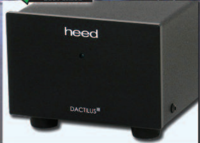
HEED DACTILUS III

BLU PRESS FDS - #03 - ISSN 1121-5313 70255 > 9 771121 531001 Prima immissione 14 MAR 2017 MENSILE dal 1991 MAR 17 6,50 €