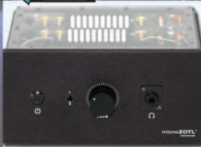
L.T.A. MICRO ZOTL 2-S