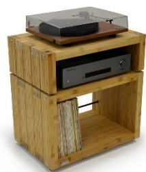
Vinyl Module con ripiano Elite ECO 24 Reference

* Disp. finitura bambù scuro con sovrapprezzo di 34 euro per ciascun ripiano.