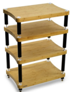
Evoque ECO 60/40 SE2

* Disponibile finitura bambù scuro con sovrapprezzo di 30 euro per ciascun ripiano.