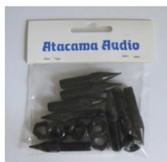
Carpet Spikes M8