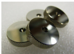
Spike Shoes HD-L