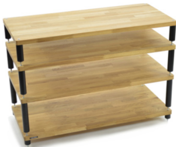
Apollo Storm 10 Hi-Fi/AV

** Disponibile finitura quercia scura con sovrapprezzo di 26 euro per ciascun ripiano.