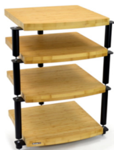
Eris 2 ECO 5.0 Hi-Fi