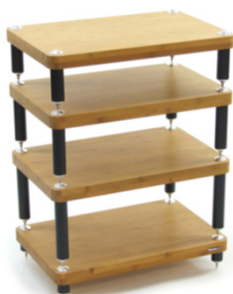
Evoque ECO 24/16 Design Edition

* Disponibile finitura bambù scuro con sovrapprezzo di 34 euro per ciascun ripiano.