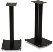
NeXXus Essential 600