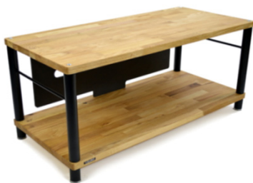
Apollo Storm 10 AV

** Disponibile finitura quercia scura con sovrapprezzo di 34 euro per ciascun ripiano.