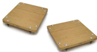
Monoplinth ECO 60/65 SE