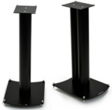
NeXXus Hi-Fi Audio 600