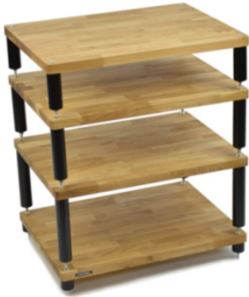
Apollo Storm 6 Hi-Fi