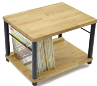
Apollo Storm 6 Vinyl Storage