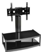
Equinox Avi TS/TL