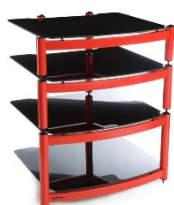
Equinox XL PRO