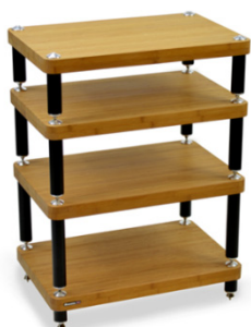
Evoque ECO 60/40 SE

* Disponibile finitura bambù scuro con sovrapprezzo di 30 euro per ciascun ripiano.