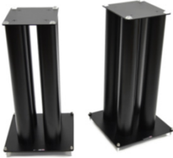
HMS 2X 600