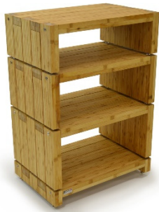
Elite ECO 24 Reference