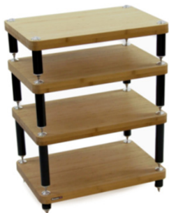
Evoque ECO 60/40