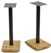
Apollo Cyclone 6

* Disponibili in finitura bianco diamante con sovrapprezzo di 30 euro.