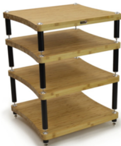
Evoque ECO 65/60 SE2 Reference