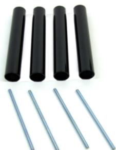
Kit colonne per Evoque ECO