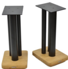
Moseco XL 600