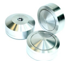
LEVIS - Novità!